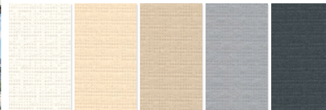
PE 90W (Weiß) PE 100W (Creme) PE 110W (Beige) PE 120W (Grau) PE 130W (Anthrazit)