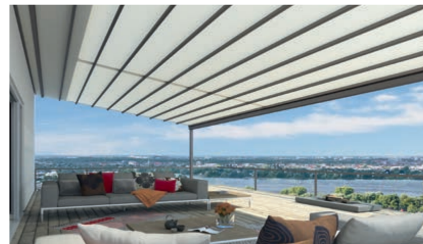
Gestellfarbe WT 029/70786 | Dessin Pergona® transluzent PE 90W (Weiß)

Das Besondere an weinor Pergona® transluzent ist die hohe Lichtdurchlässigkeit von bis zu 21 %. Natürliches Licht dringt durch das regendichte Trägergewebe, gleichzeitig verhindert es unangenehme Blendung durch die Sonne. Hochfeste Polyesterfäden machen das Gewebe äußerst widerstandsfähig, langlebig und wetterbeständig.