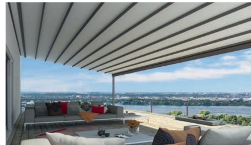
Gestellfarbe WT 029/70786 | Dessin Pergona® classic PE 140 (Weiß)

Das PVC-beschichtete Tuch weinor Pergona® classic leitet Regenwasser zuverlässig ab. Die Tücher sind nahezu blickdicht und eignen sich daher ideal zum Verdunkeln. Auch Verschmutzungen sind von unten nicht sichtbar.